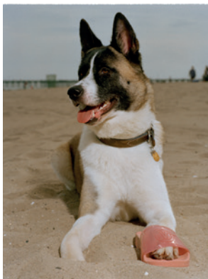
o.T., New York, 1988

Elfie Semotan Der doppelte Blick Kuriert von Katrin Bucher Trantow 25.5. bis 6.10.2024